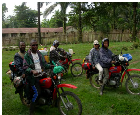
Dos representantes de nuestra Fundación con guías de la zona

Se ha retrasado el arranque del proyecto por el ataque de Mbandaka la capital de la provincia del Equateur por un grupo de rebeldes Enyele: un grupo rebelde de la tribu Enyele atacó el día 4 de abril de 2010 la ciudad de Mbandaka, consiguiendo ocupar el aeropuerto (protegido por cascos azules de la MONUC, misión de las naciones unidas en la R. D. del Congo), el parlamento provincial y la oficina del Gobernador lo que ha supuesto la interrupción temporal del programa.